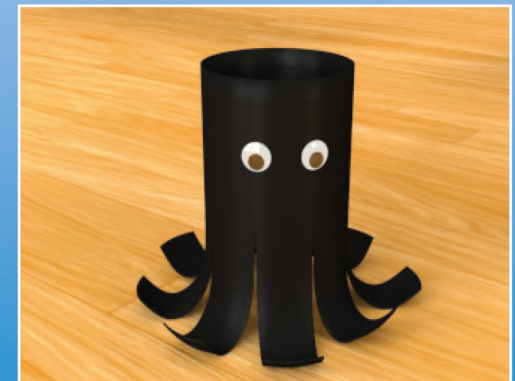
Fertig ist der Tintenfisch!

Wenn Du möchtest kannst Du noch Tintenfische in andere Farben machen!