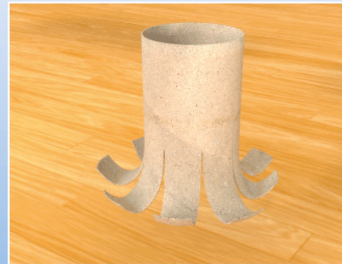
Biege nun vorsichtig die einzelnen Streifen hinaus und rolle sie ein wenig wie auf dem Bild

Um etwa die gleichen Abstände zu haben mach den zweiten Schnitt direkt gegenüber dem ersten. Den dritten und vierten Schnitt machst Du dann genau in der Mitte zwischen den ersten beiden. Mit den anderen Schnitten verfährt Du dann genauso.