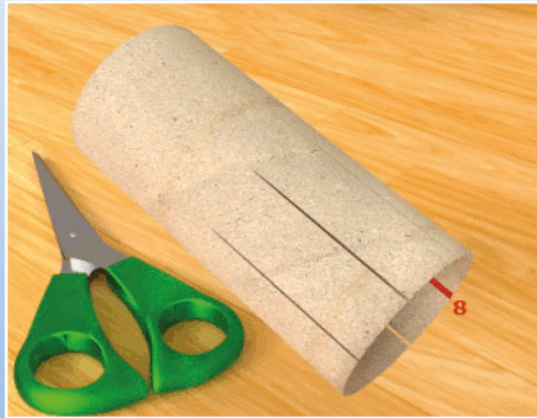
Mach von diesen Schnitten noch 7 Stk. in etwa 1 cm großen Abständen.

Um etwa die gleichen Abstände zu haben mach den zweiten Schnitt direkt gegenüber dem ersten. Den dritten und vierten Schnitt machst Du dann genau in der Mitte zwischen den ersten beiden. Mit den anderen Schnitten verfährt Du dann genauso.