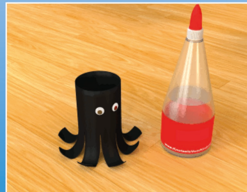
Klebe nun zwei Augen auf die Rolle. Das können fertig gekaufte Augen sein oder Du machst sie selber mit schwarzem und weißem Papier.