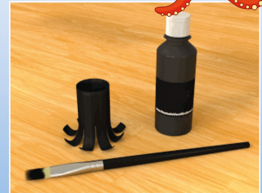
Bemal die Klopapierrolle in einer schönen Farbe.